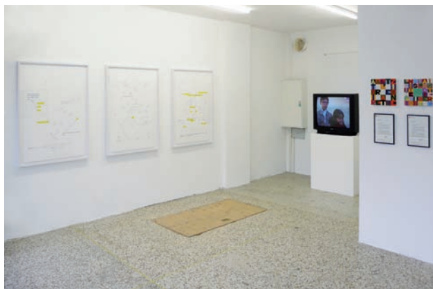
Ausstellungsansicht Critical Mass , 2008