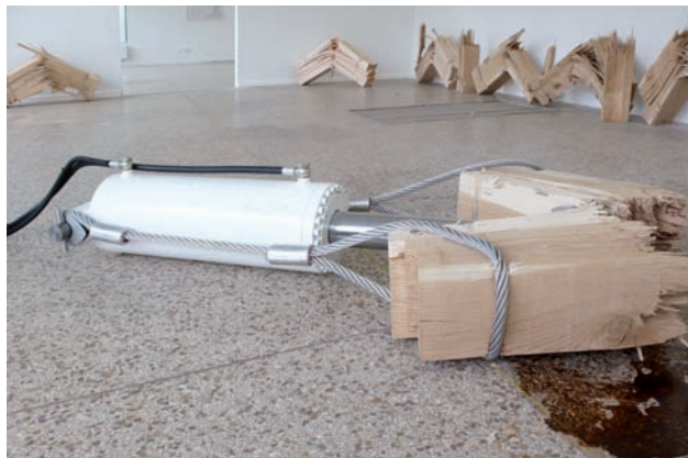
Angelo Sassolino O.T. , 2008, Verschiedene Materialien / mixed media

ground of the Schengen agreement and the present day situation of a Europe without borders, and The Practice of Everyday Life , after Michel de Certeau's book of the same title, where he writes about workers that only pretend to do their work.